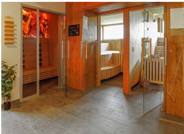
Motiv 11