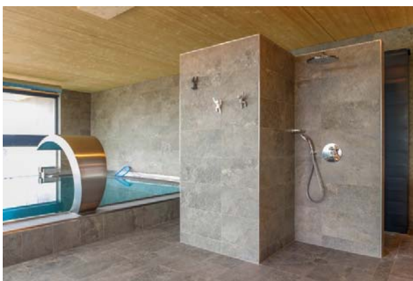
Motiv 13