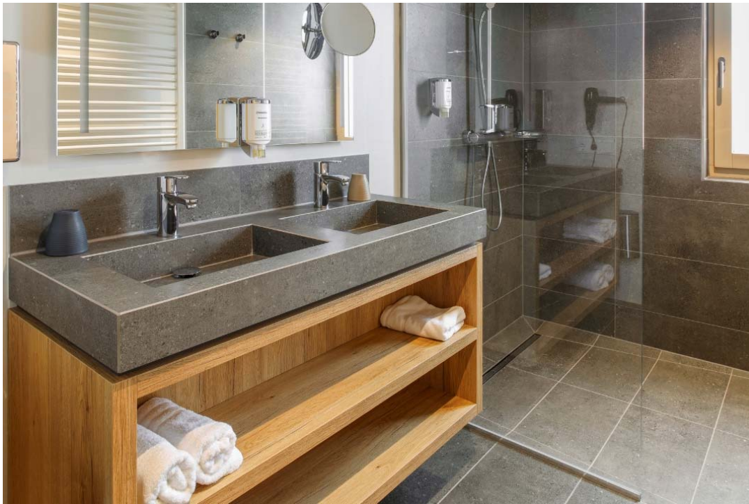
Motiv 6

Die in Volkach eingesetzte Serie Nova von Agrob Buchtal ermöglicht ganzheitliche Konzepte und zieht sich über die Wand und den Boden bis hinein in den Duschbereich. Schlüssig ergänzt wird diese stringente Raumkomposition durch den keramischen Waschtisch (hier als Doppelvariante), wobei das von Silvana Gutjahr speziell entworfene Eichenholzregal als stylish-kontrastierender Unterbau dient.