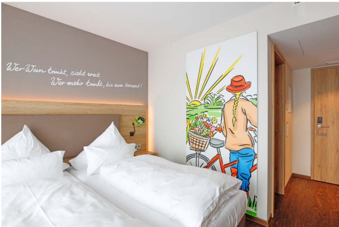
Motiv 2

Das Sonnenhotel Weingut Römmert in Volkach an der Mainschleife ist ein Themenhotel, das sich ganz der Faszination Wein widmet, um in Verbindung mit Inspiration und Wellness einen erholsamen und abwechslungsreichen Aufenthalt zu gewährleisten.