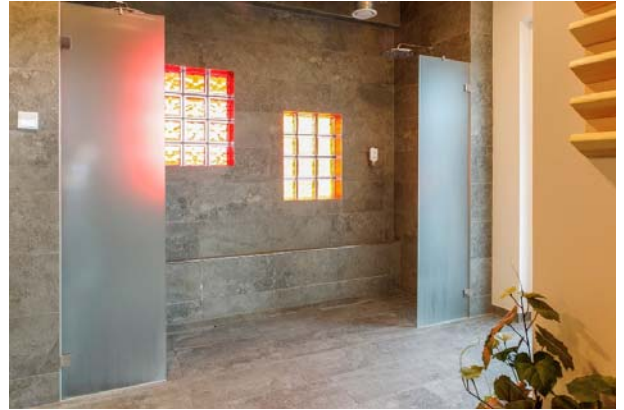
Motiv 10