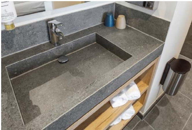
Motiv 4

Die Bäder sind in die Gästezimmer integriert, aber bei Bedarf durch eine verschiebbare, künstlerisch gestaltete Glaswand abtrennbar. Die Fliesenkollektion Nova von Agrob Buchtal fungiert dabei als architektonisches Bindeglied.