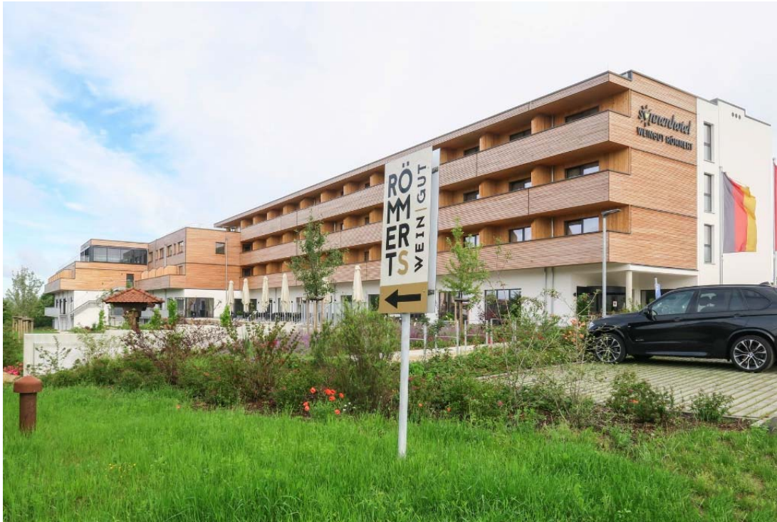
Motiv 1

Das Sonnenhotel Weingut Römmert in Volkach an der Mainschleife ist ein Themenhotel, das sich ganz der Faszination Wein widmet, um in Verbindung mit Inspiration und Wellness einen erholsamen und abwechslungsreichen Aufenthalt zu gewährleisten.