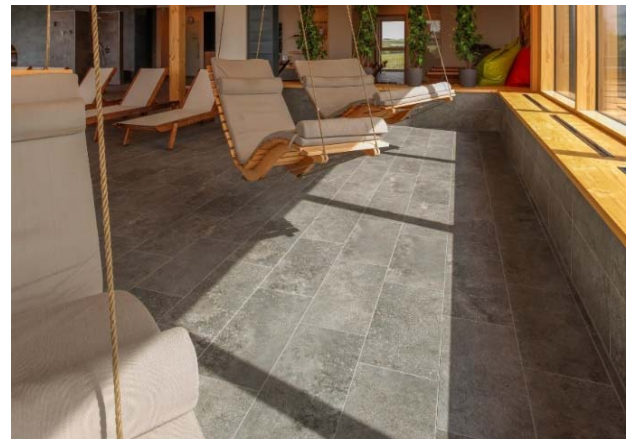
Motiv 12