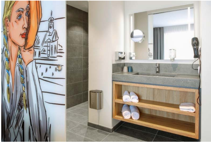
Motiv 3

Die Bäder sind in die Gästezimmer integriert, aber bei Bedarf durch eine verschiebbare, künstlerisch gestaltete Glaswand abtrennbar. Die Fliesenkollektion Nova von Agrob Buchtal fungiert dabei als architektonisches Bindeglied.