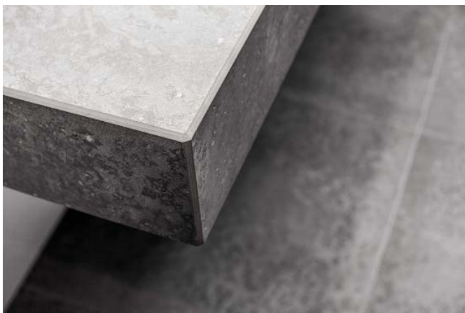
Motiv 5

Ein Blickfang in den Badezimmern ist der aus keramischen Fliesen der Marke Agrob Buchtal gefertigte Waschtisch des Systems Surf. Es wird einbaufertig geliefert inklusive eingefräster Ablaufrinne („hinter“ dem verchromten Ablauf), die das Wasser per Kapillarwirkung diskret und leise dem Ablauf zuführt.